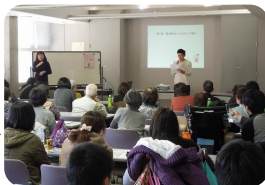
▼当事者による困りごとの話

3月15日、障がいによる 困りごとやヘルプカード の使い方についての寸劇 を上演し、好評でした。