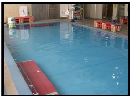
水浴訓練室の様子