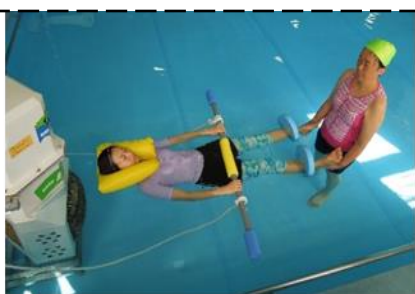
水浴訓練室の様子

水中機能訓練とは・・・ 温水プールで水の特性を利用したリハビリ運動を行います。 身体機能の改善、筋力、体力、 日常生活動作の維持・向上につながります。