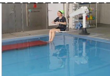
リフトがあるので車イスの方も 安心して利用できます