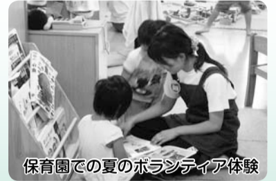
保育園での夏のボランティア体験