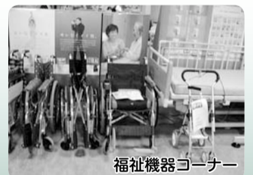
福祉機器コーナー