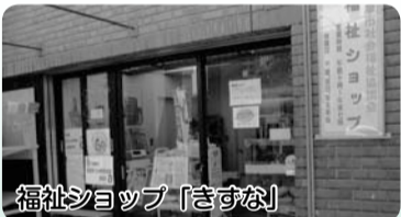
福祉ショップ「きずな」

福祉施設の手づくり品などの販売 朝採り野菜の販売 リサイクル品の委託販売 レンタルスペースの貸出 など