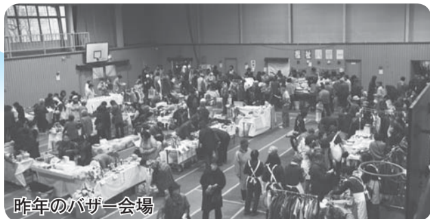
昨年のバザー会場

この事業は、多摩市社協のPRや、市内の障がい者施設や福祉団体などの活動紹介と交流の機会として開催しています。