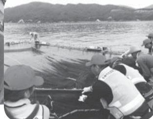
※魚の養殖も再び始まりました。

被災者(小網倉浜の漁師さん)の声 ●小網倉浜は牡蠣の養殖が漁業の中心だった。震災後牡蠣は全滅したと思われるが、幸い稚貝が若干残っていた。その稚貝を増やしていくことが地元漁師の復興への力、希望となっている。ボランティアが継続して浜に来て作業している姿は、我々漁師の気持ちを奮い立たせてもらい、精神的な支えになっている。多摩市には何らかの形で恩返しをしたい。牡蠣が成長するまで2年かかるが、必ず牡蠣をもつて行きたい。