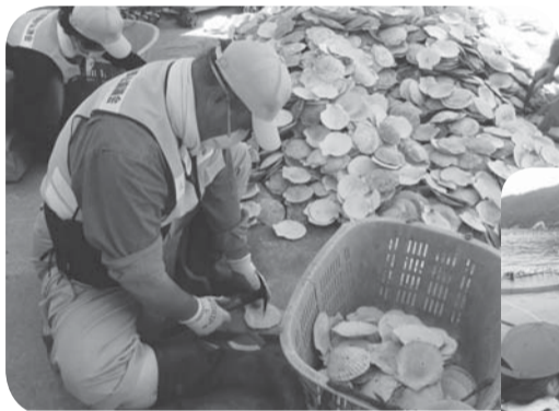
※復興に向け牡蠣の種付の準備作業(貝の穴あけ)を現地の方とともに行いました。