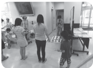
※ボランティア派遣の最終日には、避難所生活をしている子供たちとの交流の機会として、輪投げ道具と景品を用意し、ゲームを楽しみました。

被災者(小網倉浜の漁師さん)の声 ●小網倉浜は牡蠣の養殖が漁業の中心だった。震災後牡蠣は全滅したと思われるが、幸い稚貝が若干残っていた。その稚貝を増やしていくことが地元漁師の復興への力、希望となっている。ボランティアが継続して浜に来て作業している姿は、我々漁師の気持ちを奮い立たせてもらい、精神的な支えになっている。多摩市には何らかの形で恩返しをしたい。牡蠣が成長するまで2年かかるが、必ず牡蠣をもつて行きたい。