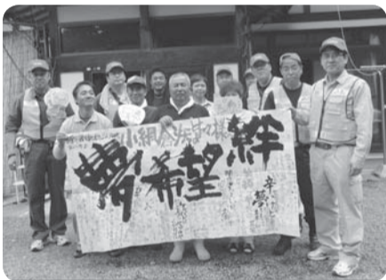
※支援物資をお届けした時に、「希望」などと書かれた寄せ書きも一緒にお渡ししました。(小網倉浜の皆様と)

多摩市社会福祉協議会(以下、多摩市社協)では、被災地支援を続けています。現在までの支援状況をお知らせします。 被災地へボランティアを派遣 ●ボランティア派遣地…宮城県石巻市(主に牡鹿半島小網倉浜) ※震災後に救援物資をお届けしたのが縁となり石巻市で活動。実施期間…6月17日から7月23日までの37日間継続して、ボランティアを派遣 ○派遣総数ボランティア108名、職員24名(多摩市職員7名含む) ○泊4日を1クールとし、各クール、ボランティア8名・職員2名で構成(計12クール派遣) ●活動内容…ガレキ撤去、漁具(ロープ、魚網等)の回収、側溝掃除、牡蠣の種付の準備(貝の穴あけ、網の修復作業等)、被災者宅支援など ●小網倉浜へ物資の支援 小網倉浜で緊急に必要とされている物資を募集し、7月21日に小網倉16行政区に届けました。 ○募集期間…7月11日から16日 ○お届けした物