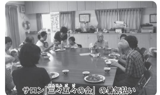
サロン「夏々五々の会」の暑気払い

おしゃべりを楽しみながら、地域の高齢者の見守り活動ができる「ふれあいサロン」、小物作りなどを楽しむ「手作りサロン」、子育て中の親子が出入りする「子育てサロン」など、市内には40か所以上のサロンが活動しています。「生きがいや楽しさが増えた」「友達ができて孤独感や不安感が解消された」などの声が寄せられ、地域での絆づくりに一役かっています。