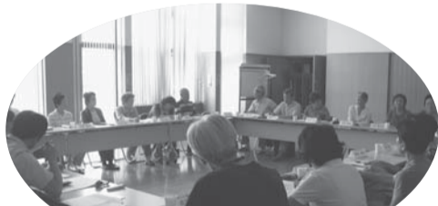
各地域で「地域福祉推進委員会」を開催しています。

市内を10のコミュニティエリアに分けて、それぞれの地域の民生・児童委員、自治会・住宅管理組合、老人クラブ、青少協地区委員会、コミュニティセンター、福祉団体、NPO団体、サロン、地域包括支援センターなどの皆様にご参加いただき、地域の情報交換や課題の解決に向けての検討を行う場として、「地域福祉推進委員会」の組織化への取り組みを行っています。