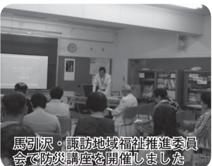
馬引沢・諏訪地域福祉推進委員会 で防災講座を開催しました

会での直後の地域の状況や災害時の課題の共有化を図りながら、改めて地域住民のつながりの大切さを再確認すると共に、今年度は地域の見守り活動の推進と併せて、地域の防災という視点についても委員会として取り組んでいこうということになりました。