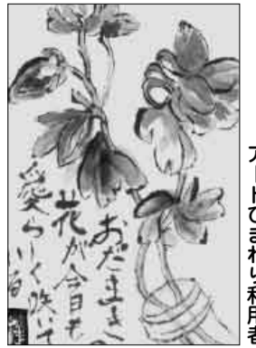
アートひまわり利用者

発行：社会福祉法人 多摩市社会福祉協議会 編集：広報広聴部 〒206-0032 多摩市南野3-15-1 (代表) ☎042-373-5611 FAX042-373-5612 ホームページ http://www.tamashakyo.jp/